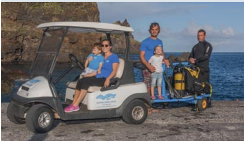
Met de golfbuggy worden duikers naar de duikplaatsen gebracht.

een anemoon, borstelworm, hengelaarsvisje, juffertjes, een kogelvis, lipvis, murene, pijlkrab, spinkrabben, sepia's, trompetvis, een goudstreepzeebrasem en een grote baars. En dit is nog maar het begin! De baars komt vlak voor me langs en ik kan heel snel een foto maken van de kop en nog een van de staart. Filipe reageert opgewonden en vertelt later dat je deze soort niet vaak ziet. Het is de Mycteroperca fusca, in het Engels de "Island grouper" of "Comb grouper". Later ontdek ik dat de vis op de rode lijst staat als een zeer bedreigde soort. Deze baars heeft een relatief klein verspreidingsgebied en komt voor van de Azoren tot Kaapverdië, bij Madeira en de Canarische eilanden. De Island grouper verzamelt zich in grote groepen om zich voort te planten aan de noordkant van