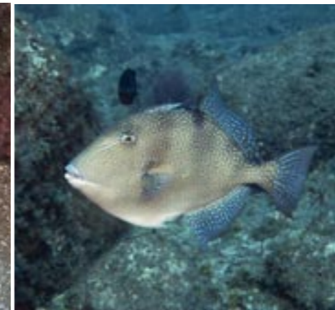
Deze grijze trekkervis bleef bij Filipe.