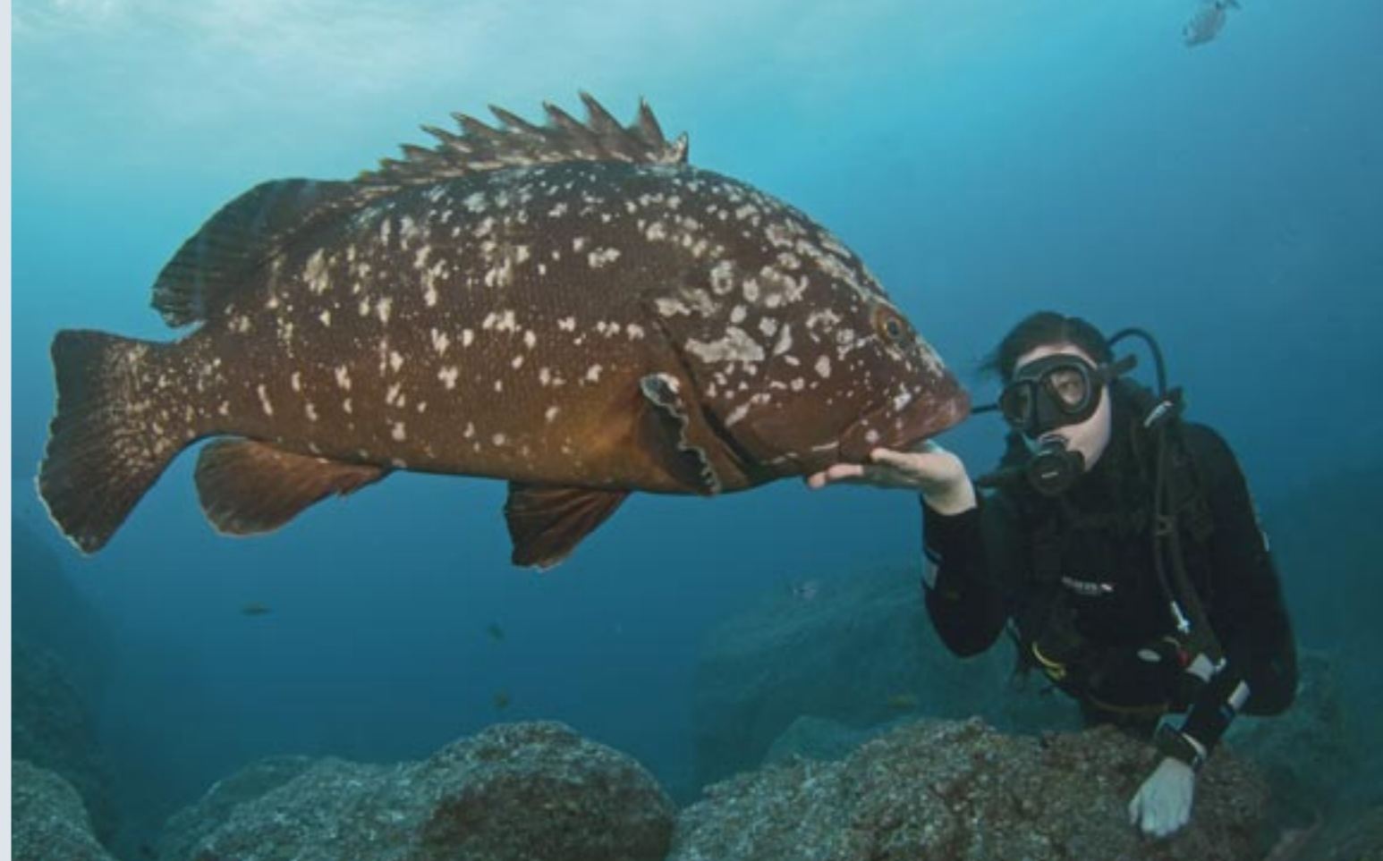
De baarzen zijn reuze vriendelijk.

Madeira. De vissers weten precies wanneer en waar dat gebeurt en hebben zo succesvol gevestigd dat de soort nu bijna is uitgeroeid.