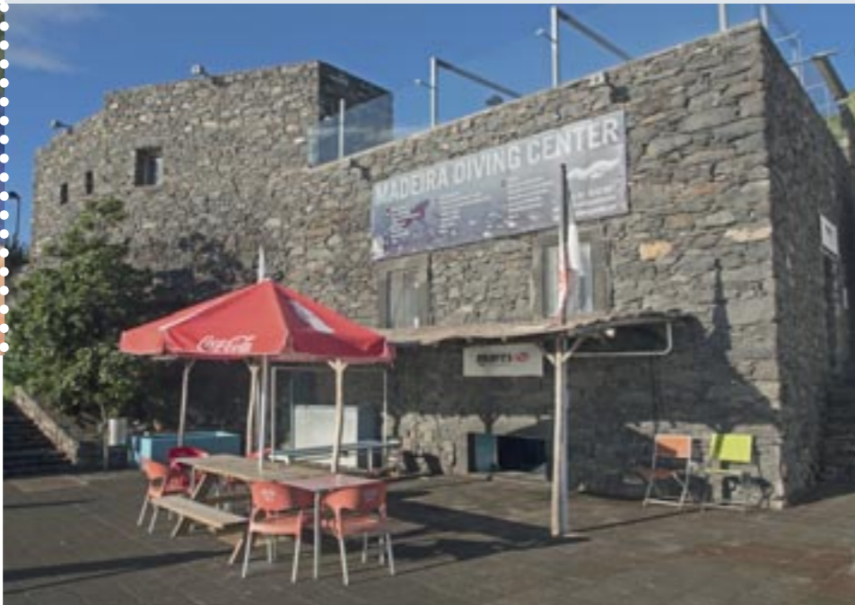
Madeira Diving Center.