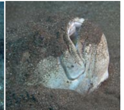
Een sterrenkijker kwam plots uit het zand.